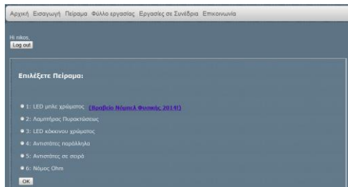
Σχήμα 3α. Η ιστοσελίδα μέσω της οποίας ο χρήστης επιλέγει το πείραμα που επιθυμεί να εκτελέσει

Στα σχήματα 3β παρατηρούμε τμήμα του πειραματικού εξοπλισμού που χρησιμοποιήθηκε για την υλοποίηση των πειραμάτων από απόσταση που αφορά τα ηλεκτρικά κυκλώματα. Όπως παρατηρούμε στο σχήμα 4 ο χρήστης μπορεί να επιλέξει ένα από τα 6 διαθέσιμα πειράματα για να εκτελέσει κάποια εργαστηριακή άσκηση. Η επιλογή του πειράματος, που πραγματοποιείται από την αντίστοιχη ιστοσελίδα (σχήμα 3α), η οποία βασίζεται σε γλώσσα PHP, και επικοινωνεί με ένα σύστημα relay (relay bank) και ένα Arduino (σχήμα 3β).