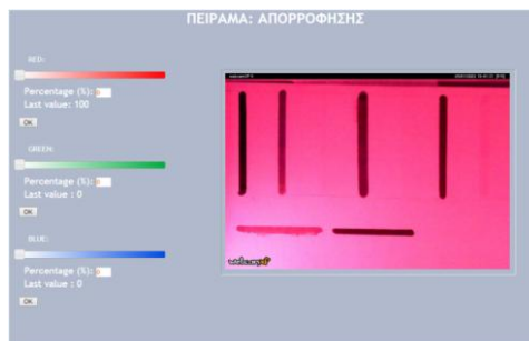
Σχήμα 5. Ο φωτισμός με κόκκινο χρώμα από το RGB LED “αλλοιώνει” χρωματικά την εικόνα που παρατηρεί ο χρήστης

Ένα άλλο πείραμα απόσταση που έχει υλοποιηθεί είναι η διάθλαση και η ανάκλαση φωτός που διέρχεται από την διεπιφάνεια υγρού - αέρα. Η γωνία πρόσπτωσης μπορεί να ορισθεί και να μετρηθούν η γωνίες διάθλασης και ανάκλασης. Οι πορείες των ακτίνων καταγράφονται από κάμερα σε πραγματικό χρόνο. Να σημειώσουμε ότι και σε αυτό το πείραμα μπορούμε εύκολα να αντικαταστήσουμε το υγρό με ένα άλλο διερευνώντας περισσότερα του ενός στοιχεία (Γιαννέλος και Πολάτογλου, 2015).