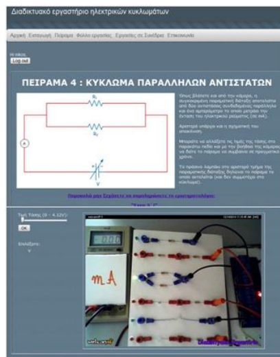
Σχήμα 4. Η ιστοσελίδα για την διεξαγωγή πειράματος όπως τη βλέπει ο χρήστης

Στο σημείο αυτό θα θέλαμε να σημειώσουμε ότι αρχικά ο χρήστης συνδέεται με τη κεντρική ιστοσελίδα του πειράματος έχοντας πρόσβαση στις διάφορες επιλογές που προσφέρει αυτή. Για την εκτέλεση πειράματος απαιτείται η δημιουργία username και password από το χρήστη. Με τον τρόπο αυτό επιτυγχάνουμε αφενός να διατηρούμε στατιστικά στοιχεία που σχετίζονται με την επισκεψιμότητα της ιστοσελίδας και αφετέρου να εξασφαλιστεί ότι ένας χρήστης κάθε φορά χρησιμοποιεί – εκτελεί την εργαστηριακή άσκηση. Μόλις ο χρήστης συνδεθεί επιτυχώς, στην οθόνη του εμφανίζεται η ιστοσελίδα μέσω της οποίας θα διεξάγει την εργαστηριακή άσκηση την οποία επέλεξε (σχήμα 4). Στην ιστοσελίδα αυτή υπάρχει μια σχηματική απεικόνιση της πειραματικής διάταξης, ένας επιλογέας τάσης, ένα ερωτηματολόγιο καθώς επίσης και η εικόνα της πειραματικής διάταξης όπως αυτή φαίνεται στο σχήμα 4.