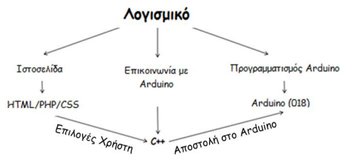
Σχήμα 2. Τα τμήματα του λογισμικού που απαιτείται για τη λειτουργία των πειραμάτων από απόσταση

Οι πειραματικές διατάξεις που είναι σήμερα διαθέσιμες από την ομάδα e-science του ΑΠΘ καλύπτουν πειράματα που αφορούν τα ηλεκτρικά κυκλώματα και πειράματα οπτικής. Τα πειράματα αυτά για να υλοποιηθούν απαιτούν τόσο την ανάπτυξη του κατάλληλου λογισμικού όσο και του πειραματικού εξοπλισμού ο οποίος βασίζεται κυρίως στο Arduino.